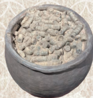
埋納銭と埋納容器 (複製品)

戦国時代、北信濃に勢力をふるった高梨氏の拠点となった中野市。中国から輸入した陶磁器を持ち、花を活け、茶や香をたしなむ優雅な暮らしが見えてきます。