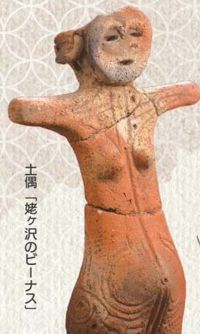
土偶「姥ヶ沢のビーナス」

山や川の恵みとともに暮らし、華麗な土器や土偶を作った縄文時代。稲作の始まりで時代は変わり、鉄の武器を持った首長が台頭する古墳時代につながります。