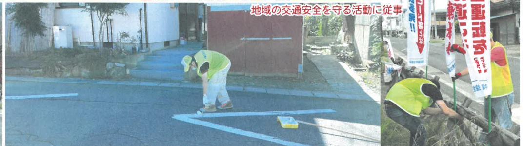
地域の交通安全を守る活動に従事