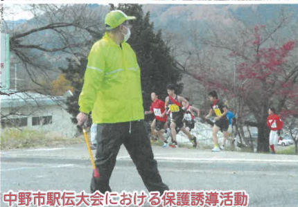
中野市駅伝大会における保護誘導活動