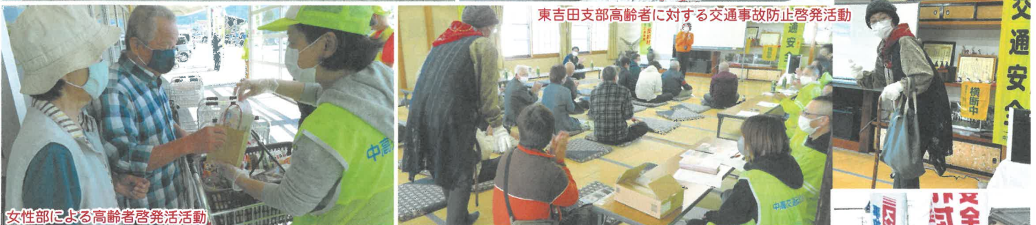
女性部による高齢者啓発活動