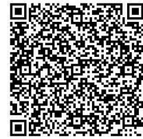
ながの電子申請サービスQRコード