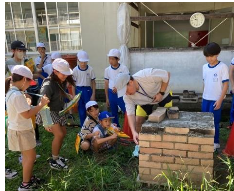
学校間交流（ピザ窯づくり）

子どもの育ちを支援するため、市立図書館では乳幼児期の読書習慣の定着を促進し、本に親しむ環境づくりを図るブックスタート事業を実施します。学校においては子どもの発達段階に応じた読書活動の推進を図ります。