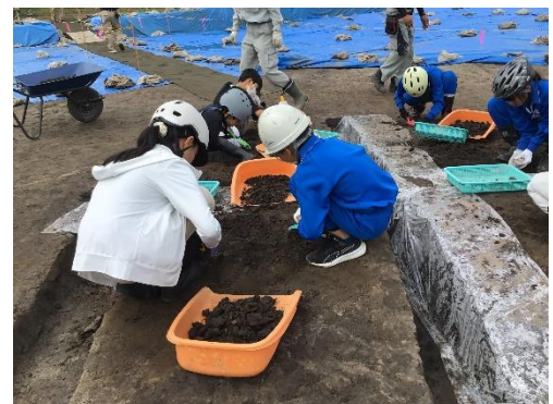
南大原遺跡発掘体験