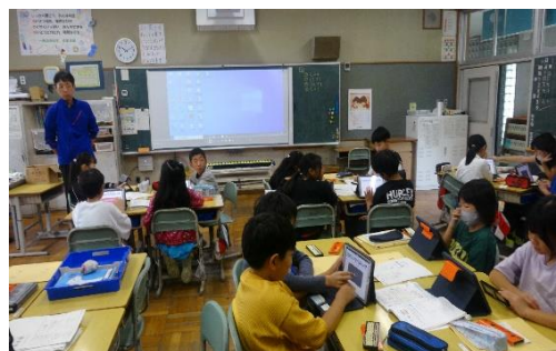
タブレットを活用した学習

ふるさとへの愛着を持ち、働くことの喜びや大切さを学ぶため、キャリア教育を推進し、地域と連携した子どもの育ちを巡る環境の充実を図ります。