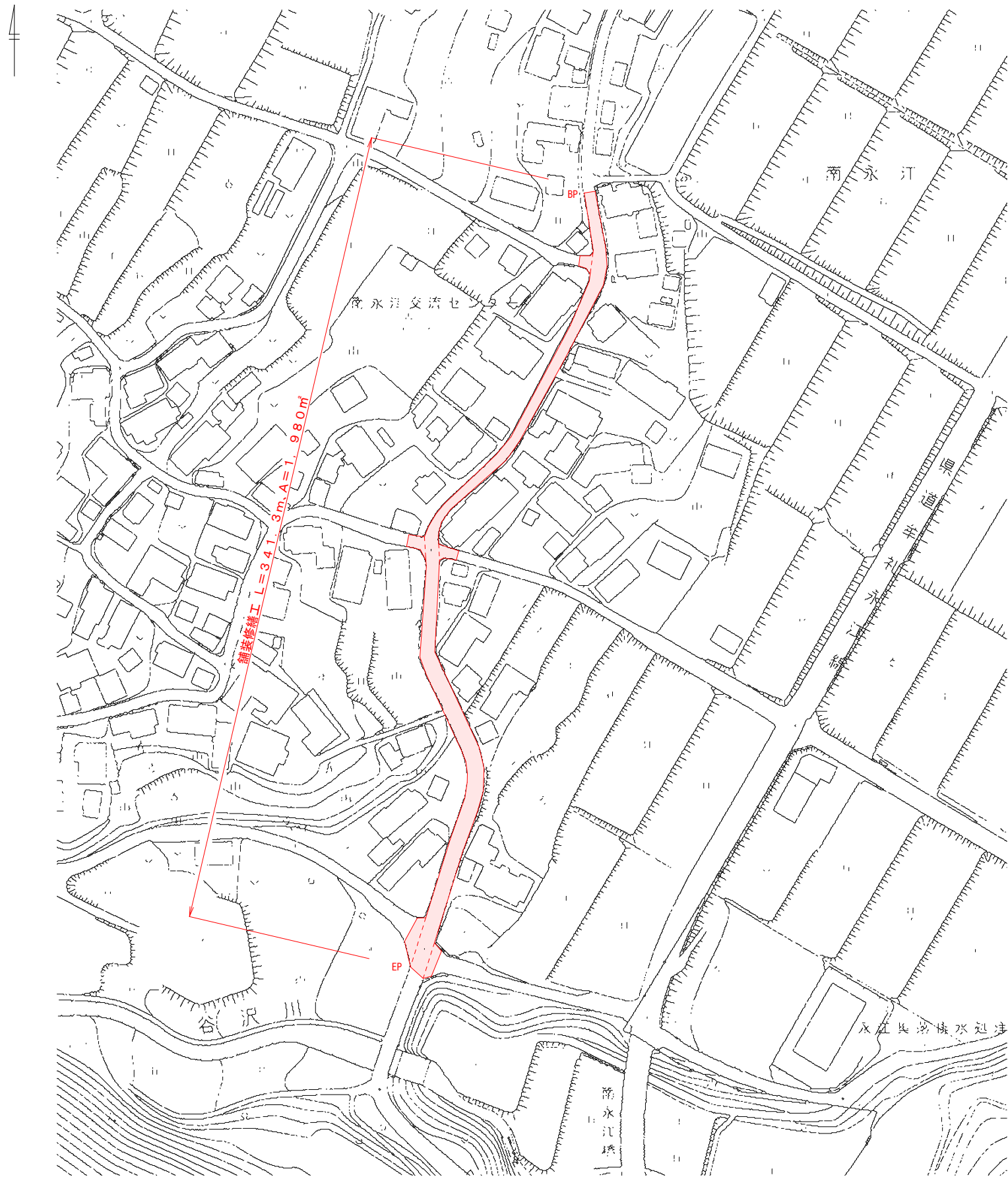
平 面 図 S=1 : 1000