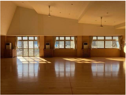
空調機設置予定位置現況（屋内）