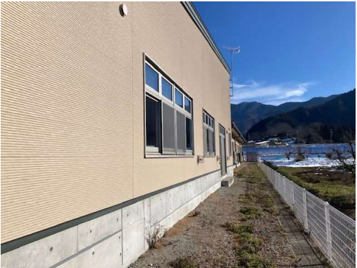
空調機設置予定位置現況（ACP-2屋外）