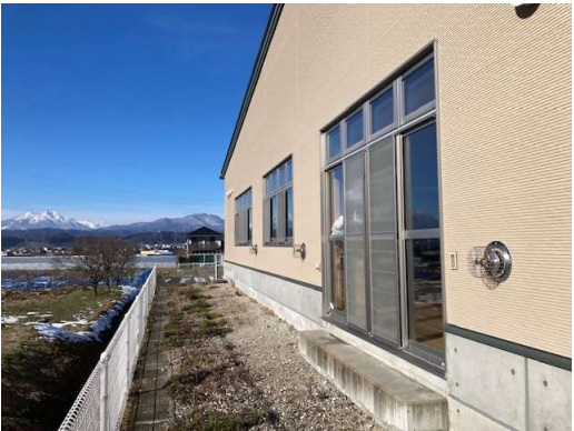
空調機設置予定位置現況（ACP-1屋外）