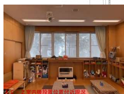
AC-2室内機設置位置現況