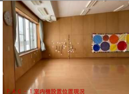
PAC-1室内機設置位置現況

ACP-1参考品番 RAS-GP224 (RGH2) 室外機 RPC-224KA室内機 AC-1参考品番 RAS-XK2526S (W) AC-2参考品番 RAS-XK7126D (W)