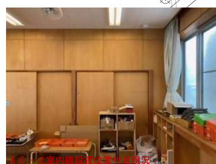
AC-2室内機設置位置現況