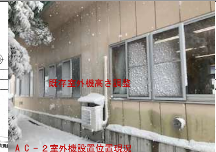
AC-2室外機設置位置現況