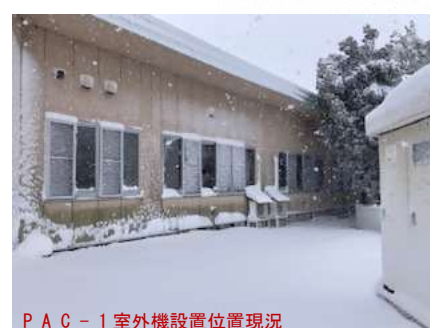
PAC-1室外機設置位置現況