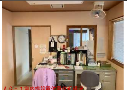
AC-1室内機設置位置現況