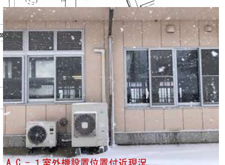
AC-1室外機設置位置現況

(注記) 特記なきは下記とする。ろがし 保護管 (P16) ● 非常照明 埋込型 表回参照 ● 避難口誘導灯 B級 表回参照