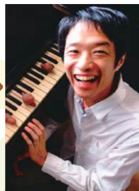
野村 誠 【作曲家・鍵盤ハーモニカ奏者】

あやしいメロディー、愉快なリズム。不思議な響きでお持ちしております。本格派の鍵盤ハーモニカ、お聞かせします。お楽しみに。