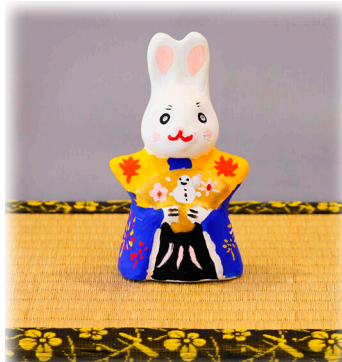
小学校高学年の部