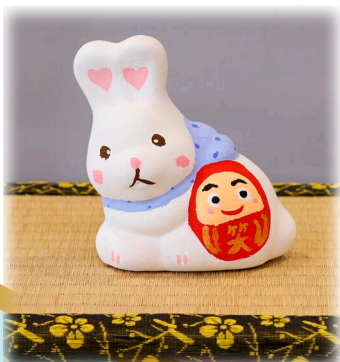
小学校低学年以下の部