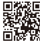
電子保証の仕組み