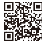
認証キーの取得方法 発注者への提出方法