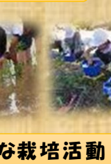
さまざまな栽培活動