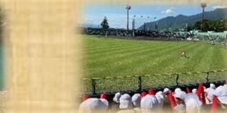
信濃グランセローズ・ソラホール見学