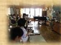
初めてのリコーダー