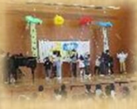
6年生といっしょに