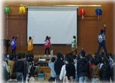
ありがとうレンジャーと2年生全員からの 「ありがとうのメッセージ」(2年生)