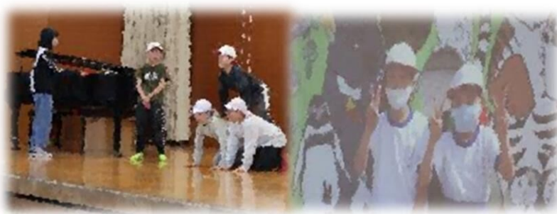
中野小学校の楽しかった思い出 実演バージョン & 思い出のアルバム(5年生)