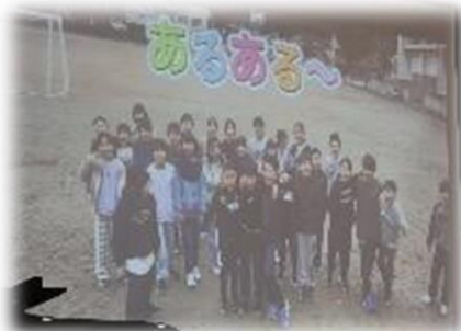
動画でおくる「中野小あるある」 「わんぱく池に落ちたことってあるよね～？あるある～！」(4年生)