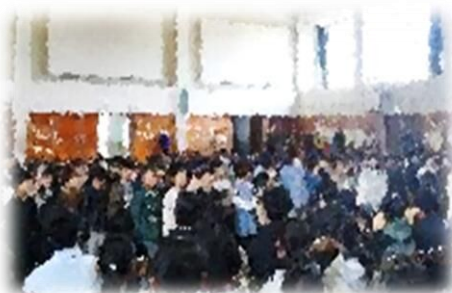
♪きょうも明日も1年生の替え歌♪ アサガオ・ヒマワリの種のプレゼント(1年生)