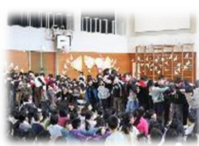
「3・2・1・カシャ！」の合図で6年生の「思い出の1枚」をプレゼント(3年生)