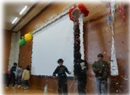
このあと・・・黄色と緑もなんとか無事に割れました！！