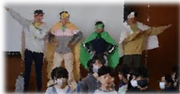
全校への呼びかけと ツナガルジャー最後のあいさつ(6年生)