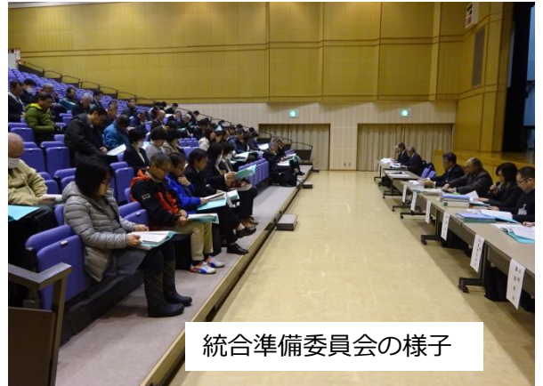
統合準備委員会の様子