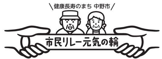
▲ 「市民リレー元気の輪」ロゴ (13ページ) 山本浩二さん作