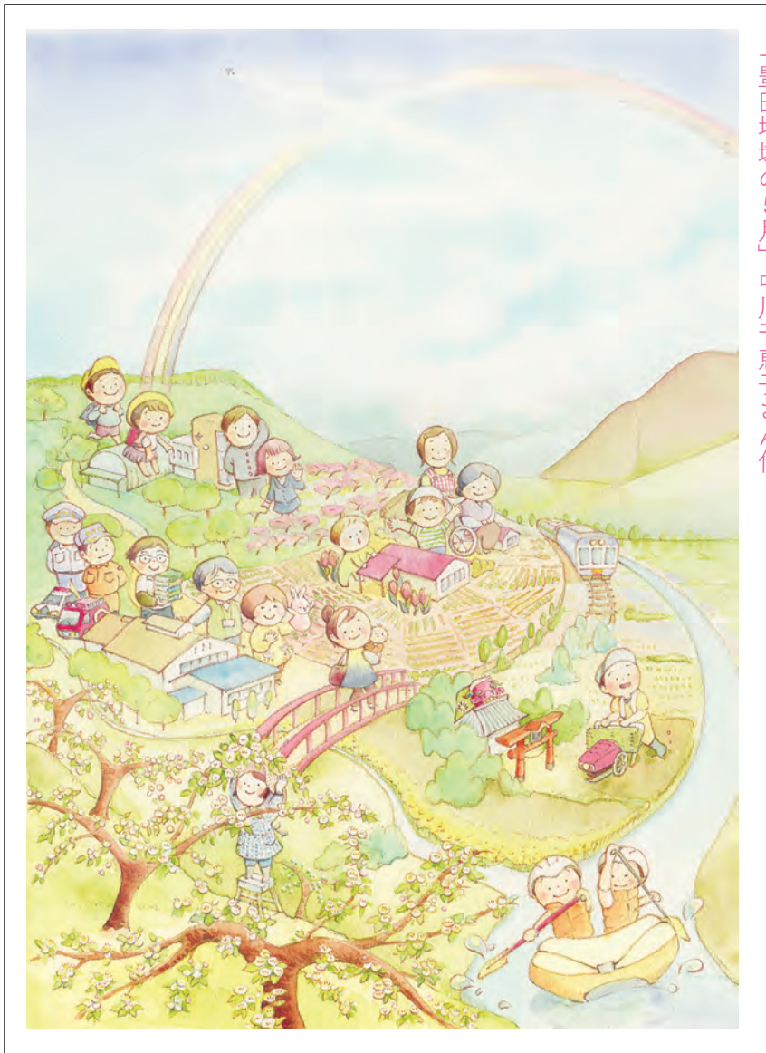
◀ 表紙のイラスト 「豊田地域の5月」 中川千恵子さん作