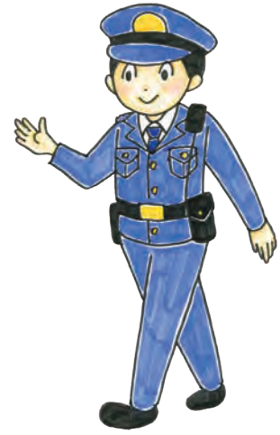
◀ 「警察官」イラスト (12ページ) 丸山沙織さん作