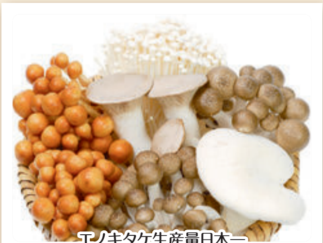
エノキタケ生産量日本一

エノキタケ生産量日本一を誇るキノコの名産地。昼夜の寒暖差や雨量の少ない気候を活かし栽培するりんごやぶどう。「信州なかの」ブランドの逸品は全国へ新しい食文化を送り続けています。