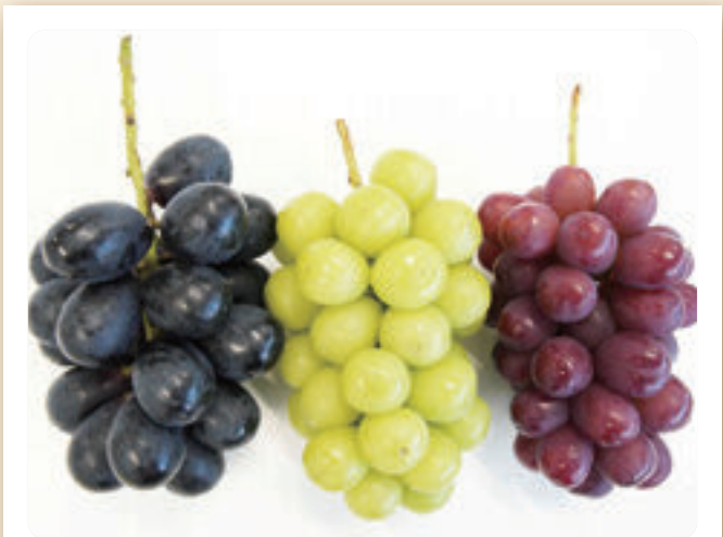
全国でも有数の産地

多品種を長期出荷していて、中野市生まれの「秋映」は甘みと酸味のバランスが良く、長野県の「りんご三兄弟」の一つとしても有名です。