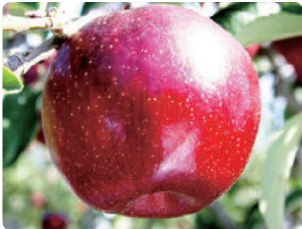
中野市生まれの「秋映」

早くからきのこ栽培に取り組み、こだわりのおいしさを追求してきました。エノキタケ・ぶなしめじ・エリンギ・なめこ・バイリングなど種類も豊富で、中でもエノキタケの生産量は日本一を誇ります。