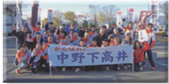
県縦断駅伝競争 会長、社員が参加