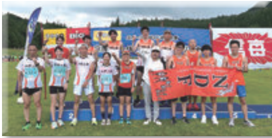
白马スノーハープ駅伝大会参加