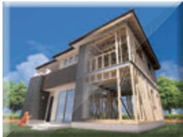
テクノストラクチャーの家