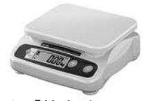
▲「特定計量器」(写真はイメージ)

農産物や食品をパック詰めしたり、学校などで体重を測定するとき使用するものなど、取引や証明などに使用するはかり(特定計量器)は、使用中の精度を確認するため、計量法の規定により、2年に1回、定期検査を受けなければなりません。