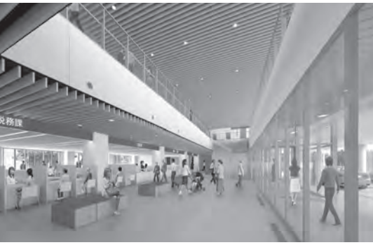
▲内観のイメージ（1階エントランス）▶鳥瞰図（北西側より）▼環境計画概念図