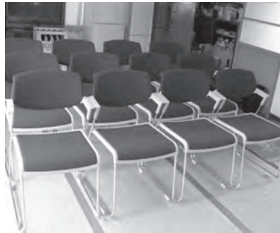
▲長元坊区で整備した 会議用椅子

神楽台車車輪や会議用椅子など、これらの備品の整備により、幅広い世代の区民が行事に参加でき、世代間交流も深まり、コミュニティ活動の一層の推進が図られます。