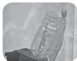
▲ペットボトルを利用した卵塊の駆除