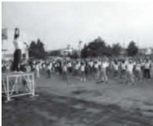
▲平成27年(2回目)開催時の様子

本市では15年ぶり3回目となる、夏期巡回ラジオ体操・みんなの体操会が開催されます。大勢の皆さんのご参加をお待ちしています。