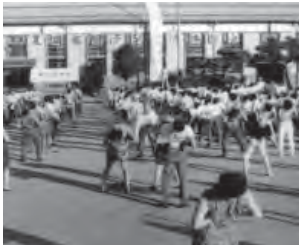
▲昭和44年(1回目)開催時の様子