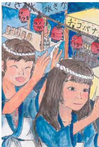
▲ポスター採用作品

本年は、市内7小学校から合計366点の応募があり、5月25日に中央公民館において、入選作品の選考が行われました。