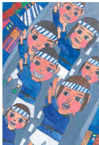
▲パンフレット採用作品