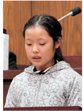
池田有沙 議員 (科野小)

《質問》 僕たちの学校、平岡小学校は、教室の照明器具が吊り下げ型の蛍光灯です。これを天井に直接固定する蛍光灯にしてください。なぜそのようなお願いをするかというと、3年半前に起きた東日本大震災の時に、教室の蛍光灯が「ゆらゆら」とゆれて落ちてきそうでした。こわい思いをしたからです。これからも、安心して勉強に集中できるようにするために、蛍光灯を天井に直接固定することを提案します。