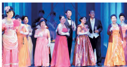
▲オペレッタこうもりの練習風景

複数の合唱団にも掛け持ちして参加しており、昨秋は「オペレッタこうもり」のステージにも立たせてもらいました。