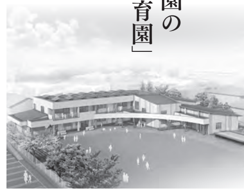
▲「ひまわり保育園」イメージ図