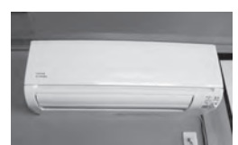
▲栗林区で整備したルームエアコン

エアコンの整備により、公会堂で行う地域行事への区民の参加を促し、世代間の交流が深まり、コミュニティ活動の一層の推進が図られます。