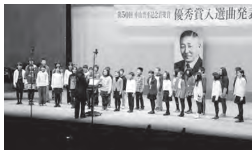
▲昨年度の優秀賞入選曲発表の様子

期日 1月24日(土) 時間 午後0時30分開演 会場 市民会館ホール 入場料 無料 内容 入選曲受賞者の表彰、優秀賞入選曲の発表、記念公演