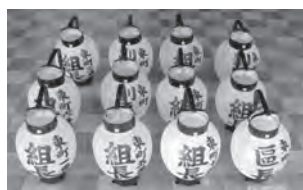
▲東町区で整備した提灯

提灯などの整備により、区民の地域行事への参加を促し、伝統文化の継承とコミュニティ活動の一層の推進が図られます。