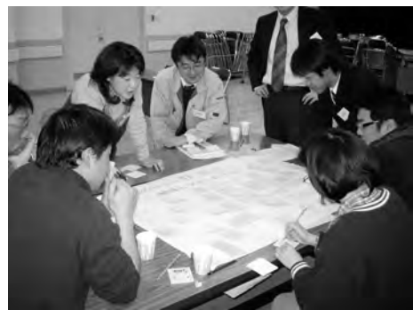
▲前回(H17年度)ワークショップ風景

※応募用紙は、市公式ホームページ( http://www.city.nakano.nagano.jp )からもダウンロードできます。