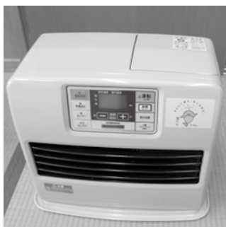
▲若宮区で整備した 石油ファンヒーター

宝くじの社会貢献広報事業である「コミュニティ助成事業」による「宝くじの助成金」を活用し、若宮区が公民館の備品を整備しました。