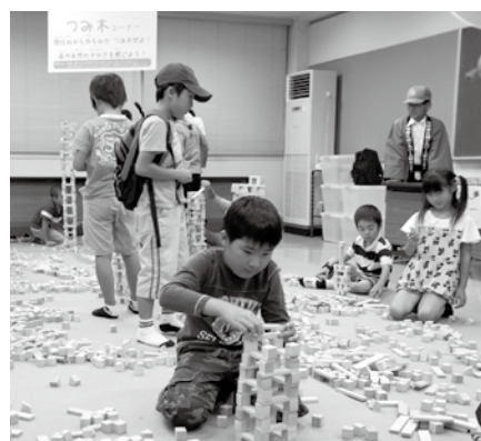
▲大人気! つみ木コーナー

会場 中野勤労者福祉センターほか 内容 環境に優しい製品・エコカーなどの展示販売、企業・団体ブース、各種体験や工作コーナー、飲食コーナー、フリーマーケットなど