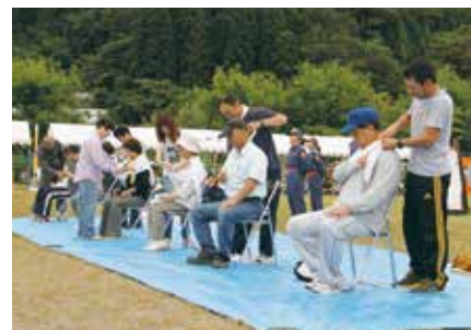
▲昨年の防災訓練の様子