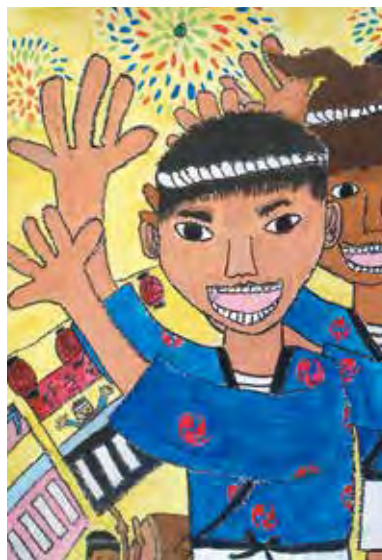
▲パンフレット採用作品