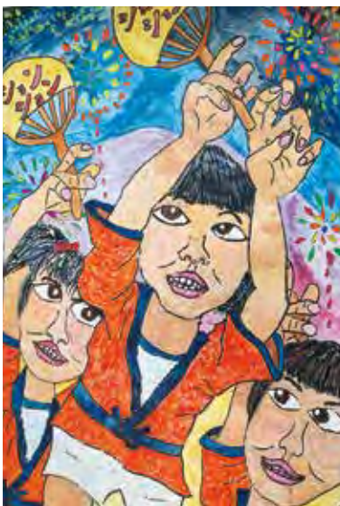
▲ポスター採用作品

「第41回中野シヨンシヨンまつり」のポスターとパンフレットの採用作品が決定しました。本年は、市内7小学校から合計342点の応募があり、5月26日に中央公民館において、入選作品の選考が行われました。