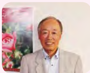
第23回ばら制定都市会議 実行委員会

会長になって初めてのバラまつりが終わりました。入園券や販売ブースのテント変更など新しいことにも挑戦し、大変な毎日でしたが、たくさんのスタッフとお客さんの笑顔に支えられて乗り切ることができました。今後は世代交代をしながら新しい発想も取り入れ、次の区切りである第30回開催を目指してまいります。