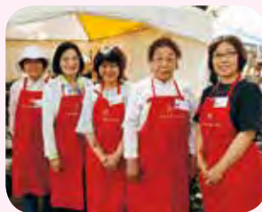
一般社団法人 一本木公園バラの会 会員の皆さん

来園者の皆さんに対し、パンフレットの配布や入場者数のチェックなどを行いました。ボランティアとして参加するのは初めてでしたが、来られた方に「ありがとう」と言われた時はとても嬉しく、この経験を自分自身のこれからも生かしていきたいと思えます。今後も、このような機会があればぜひ参加したいです。