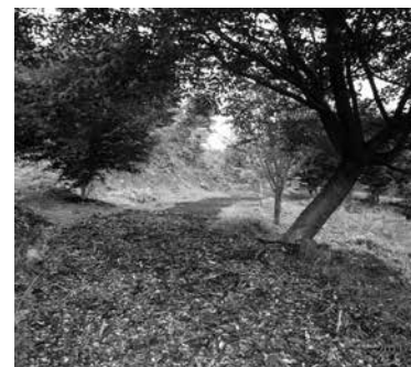
▲木製チップを敷き詰めた遊歩道

※公益的な活動を対象とし、特定の個人や事業者の利益を目的にしたものは対象外です。予算がなくなり次第受け付けを終了します。