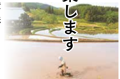
▲平成24年度中野市景観賞 景観写真部門 受賞作品

市では景観への理解を深め、美しい景観を守り、育て、創る環境づくりの推進を目的に、中野市景観賞を実施します。