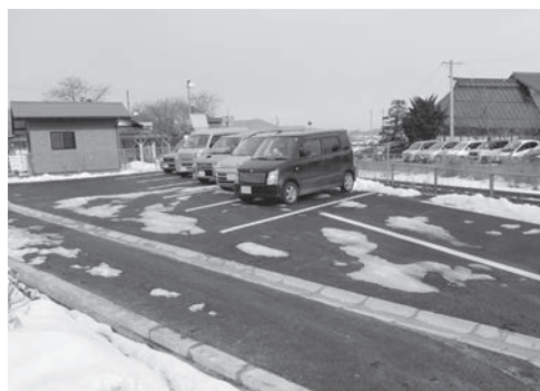
▲上今井駅南側に新たに整備した駐車場