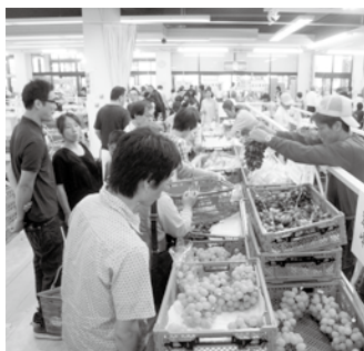
▲ぶどう販売の様子

う部会とJA中野市などが主催したもので、9月にリニューアルオープンしたばかりの会場では、30種類のぶどうが並び、試食販売や詰め放題コーナー、ぶどうの品種当てクイズなども行われました。当日は、県内外から訪れたたくさんのお客さんが、ぶどうの王様と呼ばれる巨峰や、種無しで皮ごと食べられる人氣のシャインマスカット、ナガノパールなどのほか、普段なかなか目にできない種類のぶどうを手に取り、生産者にお話を聞きながら購入していました。