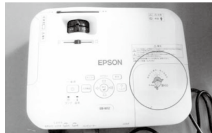
▲整備した備品の一部

西町区では、(財)自治総合センターのコミュニティ助成事業(宝くじの普及広報事業)を活用して備品を整備しました。