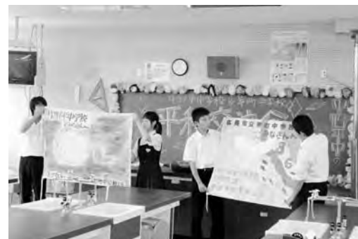
▲平和を願い翠町中学校と旗の交換