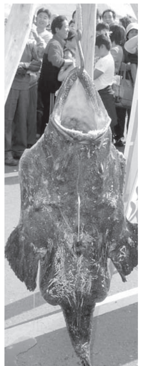
▲あんこうつるし切り

11月13日(出)、14日(日)の「中野えびす講」に合わせ、「第26回中野市産業展」を中野勤労者福祉センターで開催します。大勢の皆さんのご来場をお待ちしています。