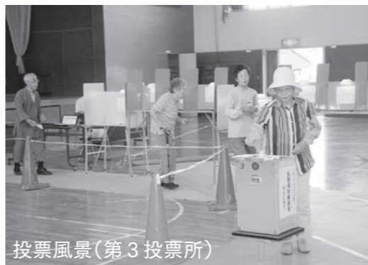
投票風景(第3投票所)