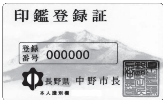
▲印鑑登録証(表面、見本)

ができます。保証人の方に「③保証書」へ自書・登録印の押印をお願いします。保証書は市役所市民課にあります。