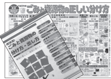
▲収集日カレンダー(上)と冊子(下)