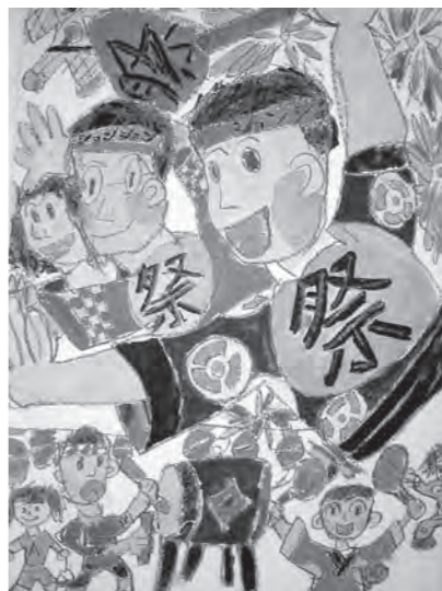
▲パンフレット採用作品