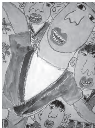
▲ポスター採用作品

「第37回中野シヨンシヨンまつり」ポスター・パンフレットの採用作品が決定しました。今年は、市内7小学校から合計356点の応募があり、5月27日(木)、中野勤労者福祉センターで入選作品の選考が行われました。なお、入選作品は8月2日(月)まで市役所本庁および豊田支所に掲示しています。