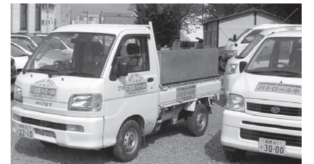
▲市内各地をパトロールしています

平成23年7月のアナログ放送終了に伴い、テレビの不法投棄増加が予想されるため、市では、今年4月から市内の