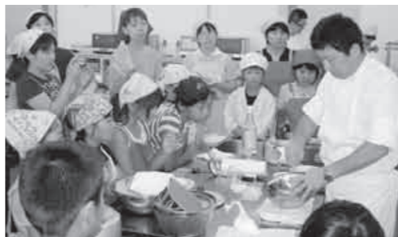
▲昨年の親子でクッキングの様子