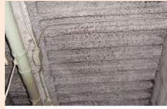
（壁・柱・天井等に吹付けられたアスベストの例）