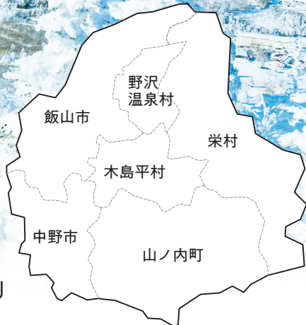
KITA SHINSHU AREA