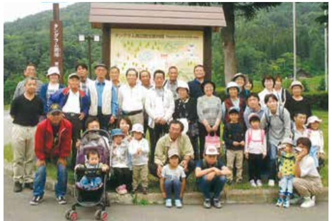
6月に開催した「ふれあい自然体験」