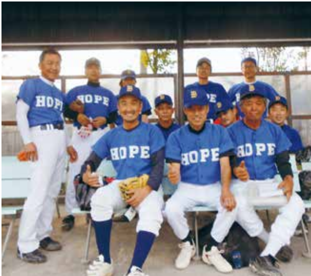
強豪チーム「HOPE若宮」の皆さん

宛先 中央公民館 ☎383-0025 中野市三好町一丁目4番27号 ☎22-2691 Eメール c-kominkan@city.nakano.nagano.jp