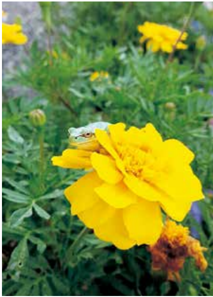
マリーゴールドとカエル／赤岩(K)