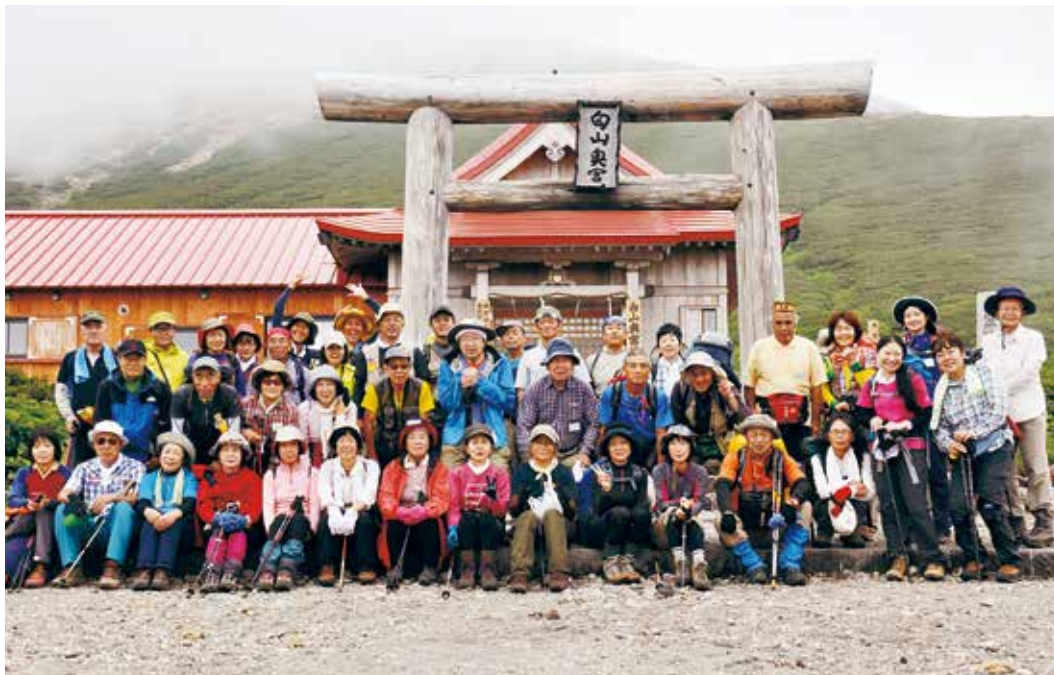
日本三名山のひとつ「白山」に登山した参加者