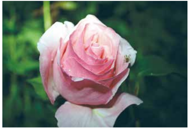
ばらの香りに誘われ／一本木公園(渡辺ト三)