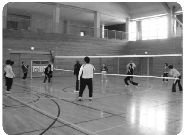
組対抗ソフトバレー大会