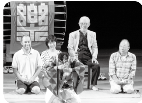
観客のみなさんもステージで笑顔

田楽座公演の前座として初めて人前で落語を披露したこと、昭和43年に、中野市連合青年団で取り組んだ市内3ヶ所での公演の思い出を語