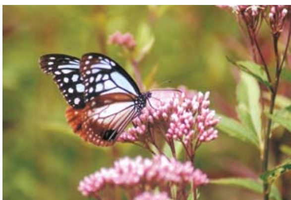
ふじばかま 藤袴／間山 (関取久江)