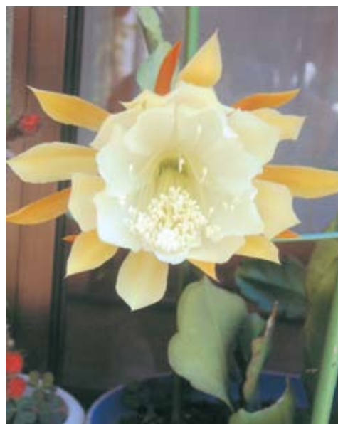
くじやく 孔雀サボテン／間山 (うさぎ)