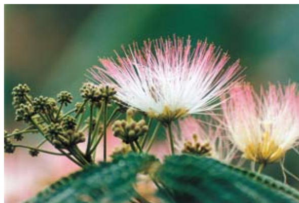
ねむ 合歡の夢は／柳沢 (倉田昭平)