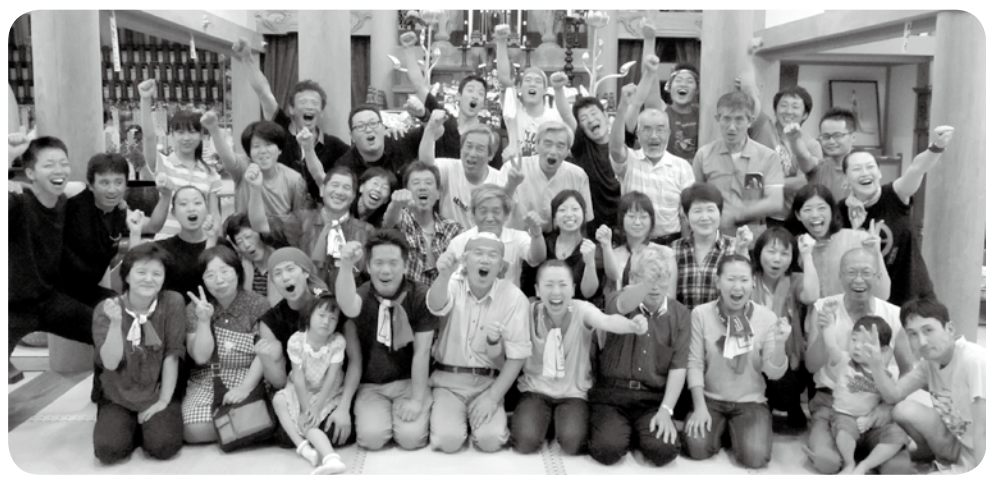
実行委員と田楽座のみなさん

公演を鑑賞されたみなさんの満足そうな表情に、実行委員それぞれが「公演を取り組んでよかった」と口々に話していました。