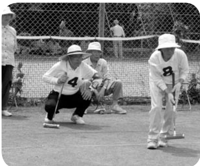
ゲートボールの真剣なまなざし