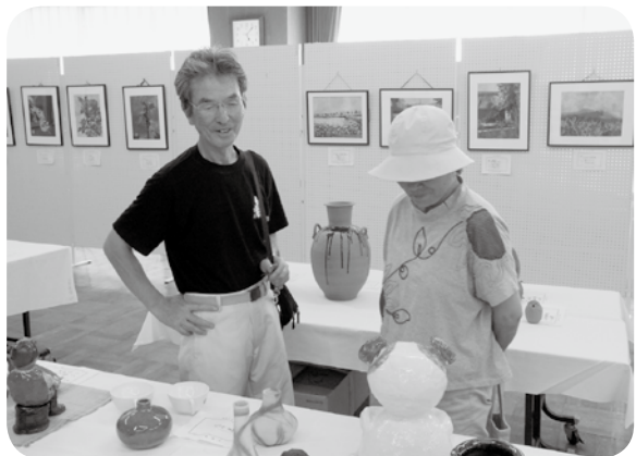
みんな素晴らしいね