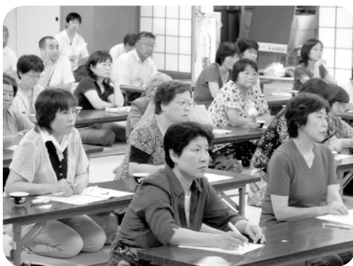
真剣なまなざしで聞き入る参加者

大切なポイントは、健康への関心を持ち、自分の状態を知るために、朝起きたら血圧と体重を測ること。若年者・中年者で朝の血圧が130を超えていたら高血圧と自覚し保健師や専門医に相談すること。食事のはじめに10分間野菜を食べることなど、寝たきを半分に減らすための方法を話されました。