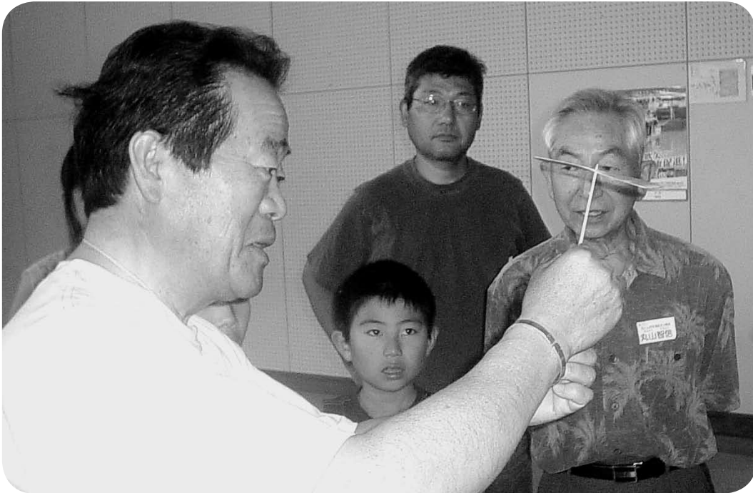
講師の「竹とんぼの飛ぶ原理」に耳を傾ける参加者