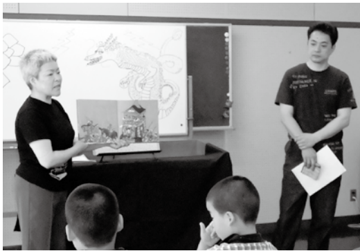
黒姫物語の読み聞かせ

お互いの思いやりを感じて行われるコミュニケーション・対話は今の殺伐とした社会には、子どもにも、大人にも大切な感性でもあり技能でもあることを感じた。