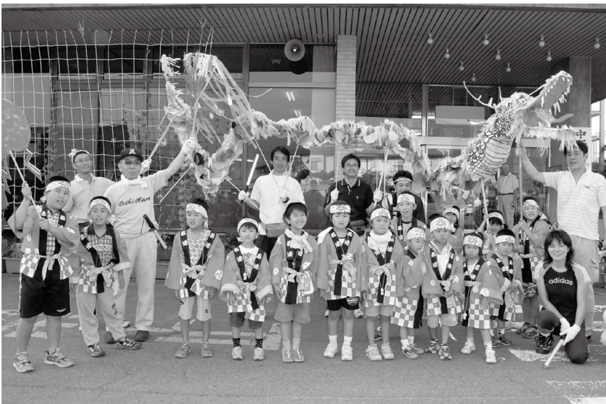
自慢の黒姫りゅうで参加する子ども達

それは、自分達で「黒姫りゅう」をつくって祇園祭に参加「出来た達成感からではないだろうか。