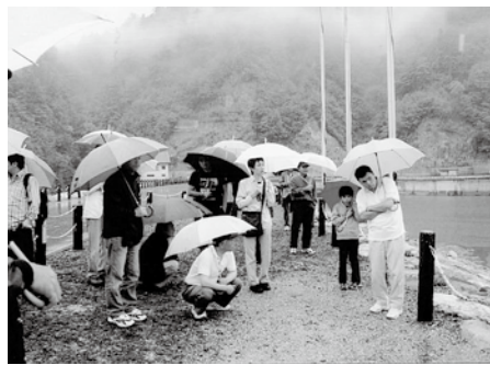
分館研修会にて高瀬川ダムを見学