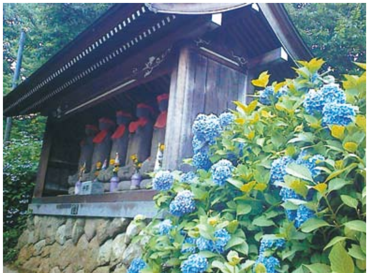
アジサイ / 谷厳寺 (月岡尚雄)