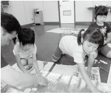
龍の胴体に鱗（カラーポリ）を自由に貼っている

制作は専門委員（教育関係者6名で事業の企画に参画）と一緒に、龍の胴体に、丸く切った様々な色のカラーポリ（ビニール素材の袋）を、鱗として貼り