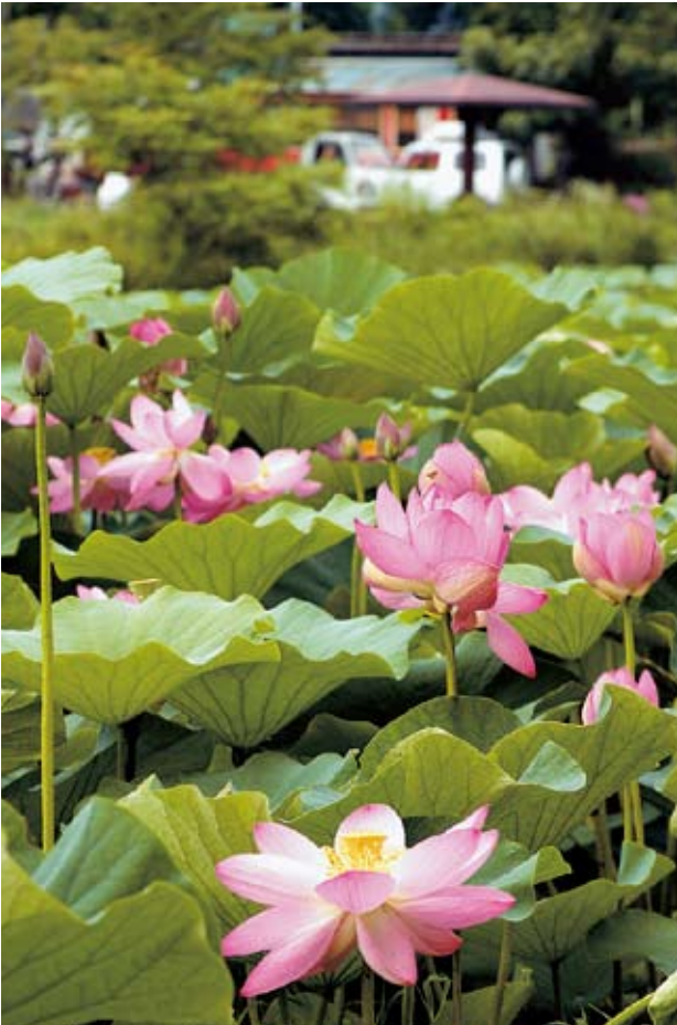
ハス / 浜津ヶ池 (t)