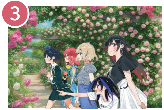
3 中央公民館の駐車場付近にあるデザインマンホール。一本木公園内イングリッシュガーデンのバラのパラと彼女たちのイラストとのコラボ。