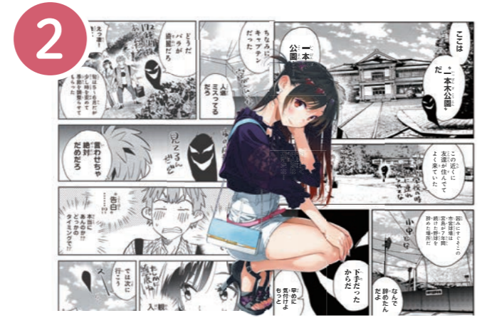
2 中野市立図書館西側付近にあるデザインマンホール。中野市特別読み切り小冊子漫画の一本木公園でのシーンと単行本 19 巻表紙イラストのコラボ。