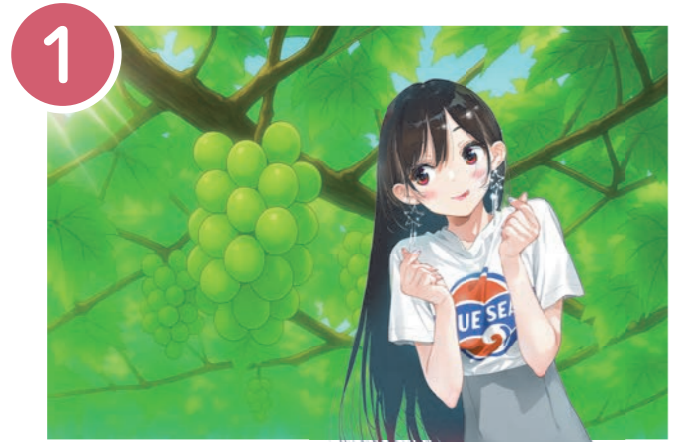
1 信州中野駅の南側にあるデザインマンホール。中野市が誇る名農産品のシャインマスカットと単行本 32 巻表紙イラストのコラボ。