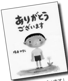
「ありがとうございます」 塚本やすし || 作・絵 富士房インターナショナル