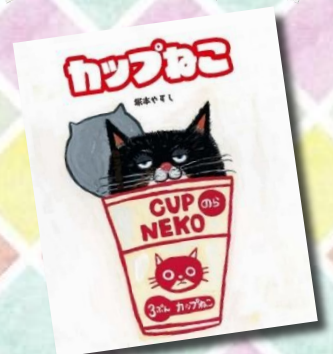
「カップねこ」 塚本やすし || 作・絵 ニコモ