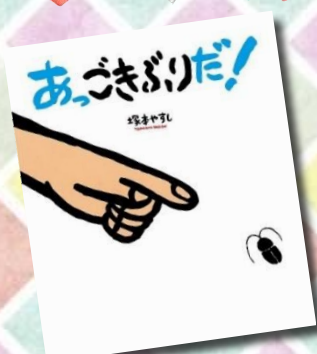
「あっきぶりだ!」 塚本やすし || 作・絵 ポプラ社