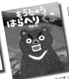
「もうじゅうはらへりぐま」 塚本やすし || 作・絵 ポプラ社