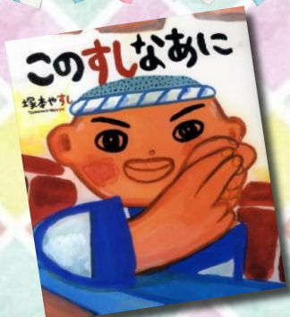
「このすしなあに」 塚本やすし || 作・絵 ポプラ社