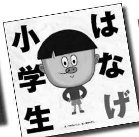
「はなげ小学生」 すけたけしん || 文 塚本やすし || 絵 小学館