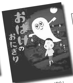
「おばけのおにぎり」 塚本やすし || 作・絵 ニコモ