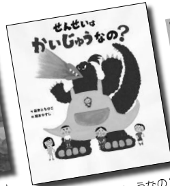
「せんせいはいじゅうなの?」 藤本ともひこ || 作 塚本やすし || 絵 バイインターナショナル