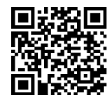
ガラケー用 QRコード