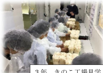
3年 きのこ工場見学