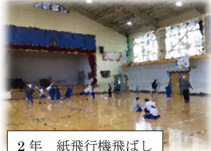
2年 紙飛行機飛ばし