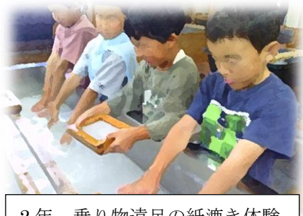
2年 乗り物遠足の紙漉き体験