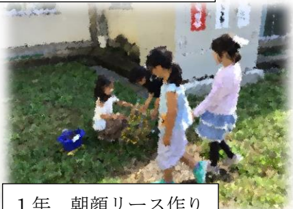
1年 朝顔リース作り