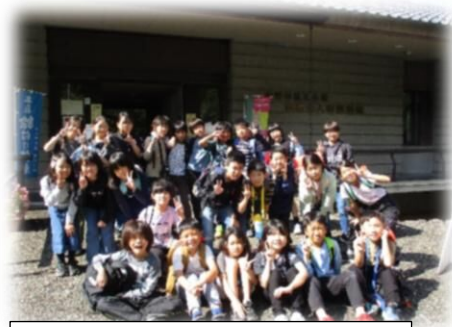
4年生「土びなの絵付け体験」