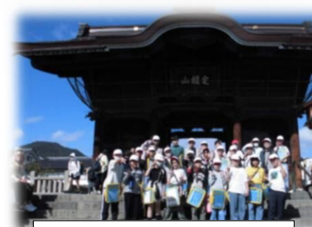
5年生「長野市社会見学」