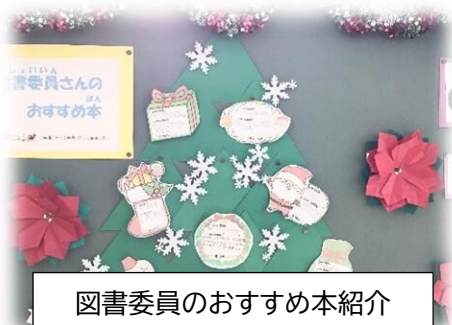
図書委員のおすすめ本紹介