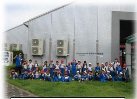
1年生「浜津ヶ池遠足」