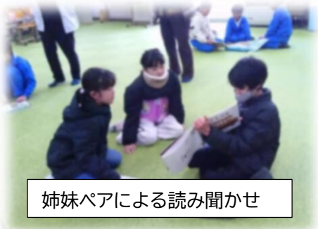
姉妹ペアによる読み聞かせ

12月1日（月）～12日（金）は読書旬間でした。読み聞かせや読書ビンゴ、図書委員によるおすすめ本の紹介などの活動を通して、本の世界を楽しみ、さらに読書が好きになった子ども達がたくさんいたのではないのでしょうか。自宅でも「家庭読書」への取り組みにご協力いただきありがとうございました。これからも、たくさんの本に出会って行ってほしいと思います。