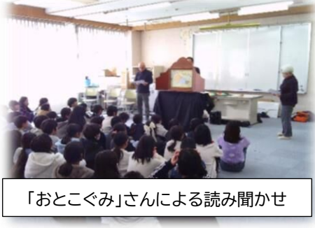
「おとこぐみ」さんによる読み聞かせ