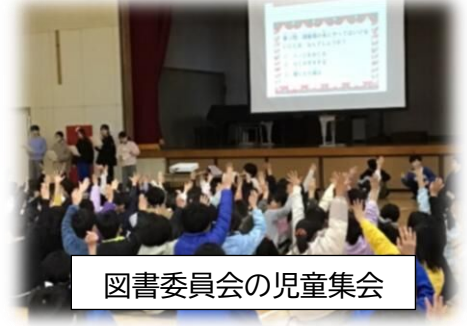
図書委員会の児童集会