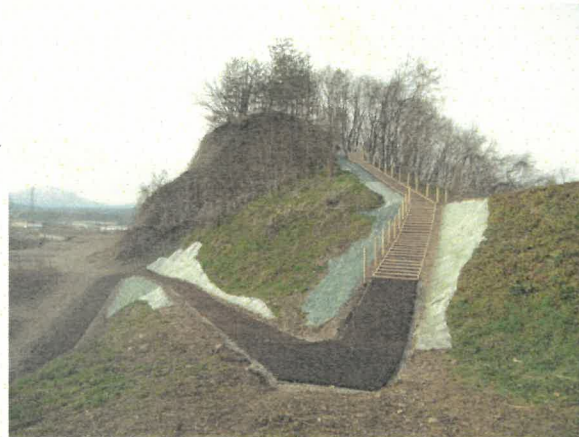
令和4年度工事:園路設置状況(南から)