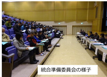
統合準備委員会の様子